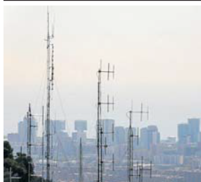
Diverses ràdios pirates emeten des de la zona del Carmel. MARC ROVIRA